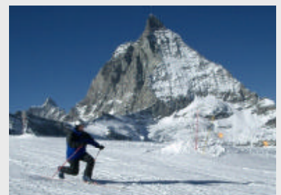
Telemark-Kurse werden auch während der Pfälzer Skiwoche in Zermatt angeboten, Telemark-Leihmaterial ist vorhanden.