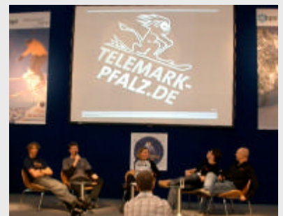
Die Telemark-Pfalz präsentiert sich im Rahmen des "Backcountry & Free-Heel Summit" auf der ispo 2004

Wer mehr über die Telemark-Pfalz erfahren möchte, findet alle Infos unter www.telemark-pfalz.de .