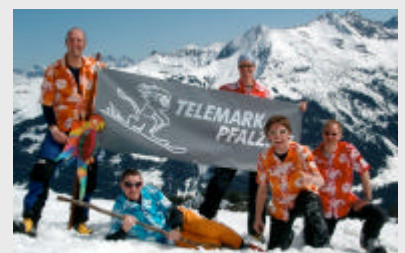
Beim Telemark-Festival im Kleinwalsertal